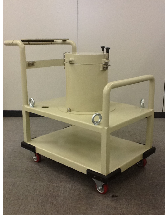
図. SAM940 用鉛遮蔽体