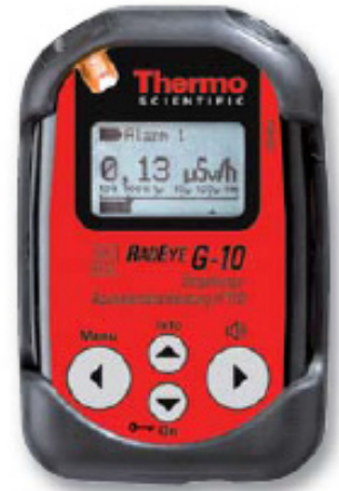
RadEye G-10: # 4250676