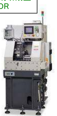
全自動外輪溝研削盤 SG1-OR