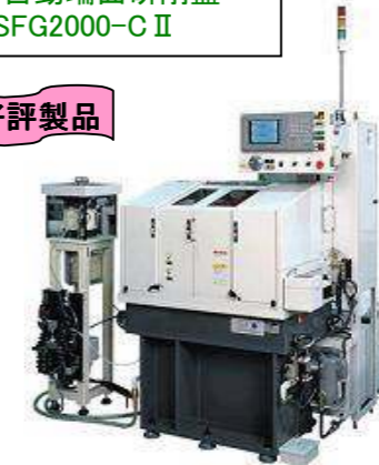
全自動端面研削盤 SFG2000-C II