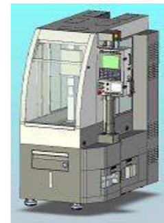
小型縦型マシンングセンター HM-V20