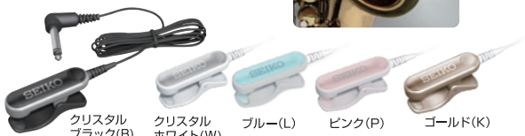
クリスタルブラック(B)