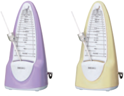
ラベンダーパープル(LV) ハステレイエロー(Y)