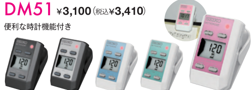
ブラック(B) シルバー(S) アクアブルー(L) ミントグリーン(G) パールピンク(P)