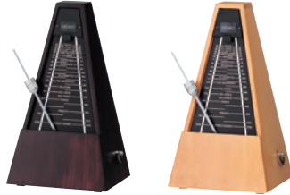
クラシックブラウン(B) ナチュラル(N)