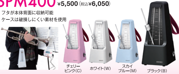
チェリーピンク(C) ホワイト(W) スカイブルー(M) ブラック(B)