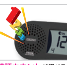
英語カウントが選べる