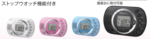
ホワイト(W) ピンク(P) ブルー(L) ブラック(B)