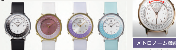
SMW001B ブラック SMW002B ピンク SMW003B パープル SMW004B ブルー