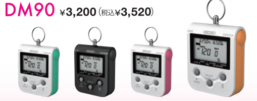
アップルグリーン(G) ブラック(B) ラズベリーピンク(P) マンゴーオレンジ(O)