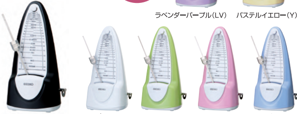
ノールブラック(B) ピュアホワイト(W) ライムグリーン(G) チェリーピンク(C) スカイブルー(M)