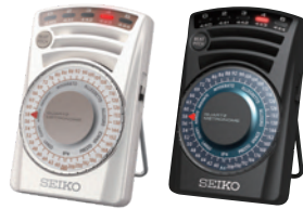
ホワイト(W) ブラック(B)