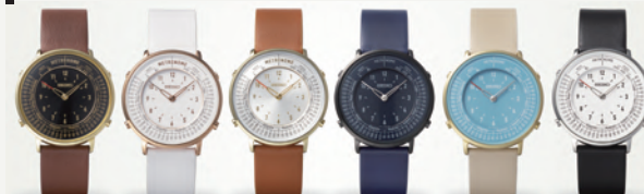
SMW001A ダークブラウン SMW002A ホワイト SMW003A キャメル SMW004A ネイビー SMW005A ターコイズ SMW006A モノトーン