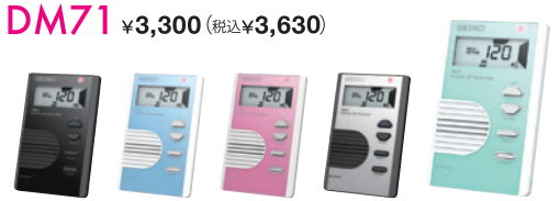
ブラック(B) アクアブルー(L) パールピンク(P) シルバー(S) ミントグリーン(G)