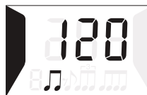
Skärmen i metronomläget METRONOME

Ställ in tiden genom att försätta metronomen i klockläge och sedan hålla in BEAT-knappen. Välj timmar eller minuter genom att trycka på BEAT-knappen och justera siffrorna med hjälp av knapparna tempo UP (upp) och DOWN (ner). De siffror som är valda blinkar. Tryck på funktionslägesknappen när du vill gå ur eller återgå till klockläget. Det går inte att ändra sekundvisningen. Den ställs automatiskt in på noll. Tiden kan ställas in på sekunder genom manuellt synkronisering med en officiell klocka. Metronomen återgår automatiskt till klockläget efter en minuts inaktivitet.