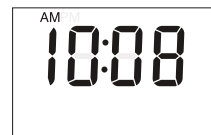
Skärmen i klockläget CLOCK